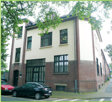
Das neue Domizil von platin-e in der Adolfstr. 54, Ecke Gerberstraße